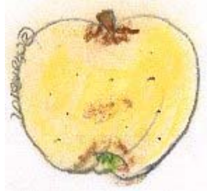
Pastel Choisel Jean-Louis 2007 © selon Van Noort 1830

Fichier Choisel jean-louis-©2006-2007-2008